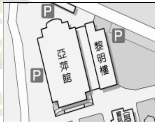
亞萍館位於宿舍隔壁(如右)